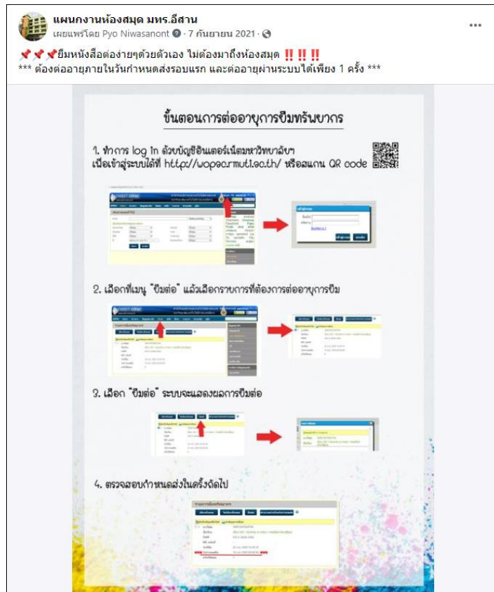
ภาพที่ 2 การยืมต่อหนังสือออนไลน์